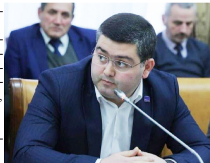
информационного центра "ТАСС Кавказ". Новый центр будет подспорьем не только нам всем, но

"Это первый большой региональный информационный центр за последние десять лет, который открывает ТАСС. Мы открылись накануне большого инвестиционного форума на