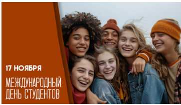
17 НОЯБРЯ МЕЖДУНАРОДНЫЙ ДЕНЬ СТУДЕНТОВ

Для студентов День студента — это не только повод получать знания и учиться. Это — активное участие в жизни общества. Многие из них активно занимаются благотворительностью, волонтерством, экологическими инициативами и движениями за права человека. Они организуют благотворительные акции, участвуют в экологических субботниках, помогают в приютах для животных и собирают средства для социальных программ. Эти поступки подчеркивают, что каждый из них способен внести свой вклад и стать агентом позитивных перемен. Когда коллектив молодых людей объединяется, чтобы делать добро, масштабы их усилий заметно возрастают. Именно такие добрые дела рожают настоящие чудеса, создают атмосферу единства и вдохнове-