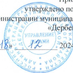
Схема размещения нестационарных объектов потребительского рынка на территории Муниципального района «Дербентский район» - с. Аглоби

Приложение № 15 утверждено постановлением администрации муниципального района «Дербентский район» от «18» 12 2024 года № 314