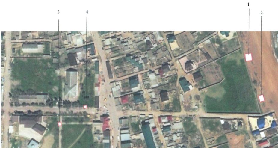
Схема размещения нестационарных объектов потребительского рынка на территории Муниципального района «Дербентский район» - с.Хазар

Приложение №1 утверждено постановлением администрации муниципального района «Дербентский район» от «24» марта 2023 года № 80