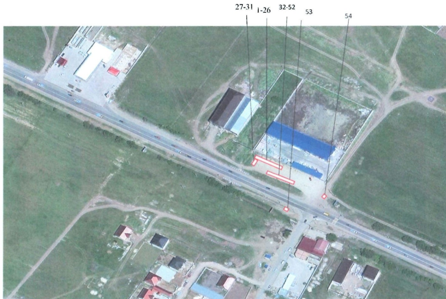
Схема размещения нестационарных объектов потребительского рынка на территории Муниципального района «Дербентский район» - с.Сабнова