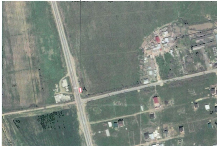
Схема размещения нестационарных объектов потребительского рынка на территории Муниципального района «Дербентский район» - с.Хазар