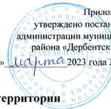
Схема размещения нестационарных объектов потребительского рынка на территории Муниципального района «Дербентский район» - с.Падар