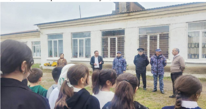
Управление образования Дербентского района

После окончания тренировки занятия в ОУ возобновились в полном объеме. Подобные мероприятия формируют у воспитанников и сотрудников детского сада ответственное отношение к выполнению правил антитеррористической безопасности, развивают умения и навыки, необходимые для правильного поведения в экстремальных ситуациях.