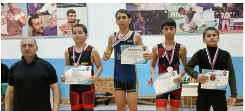
Отдел спорта Управления образования Дербентского района

Поздравляем тренера и воспитанников с победой!