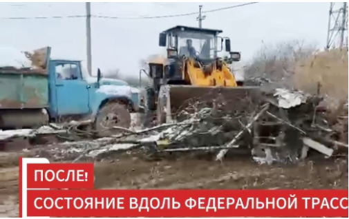
ПОСЛЕ! СОСТОЯНИЕ ВДОЛЬ ФЕДЕРАЛЬНОЙ ТРАССЫ

Важно подчеркнуть, что проводимые работы не являются